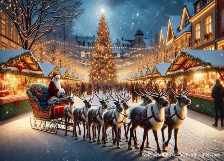
Weihnacht-Bild von McZerrill auf Pixabay