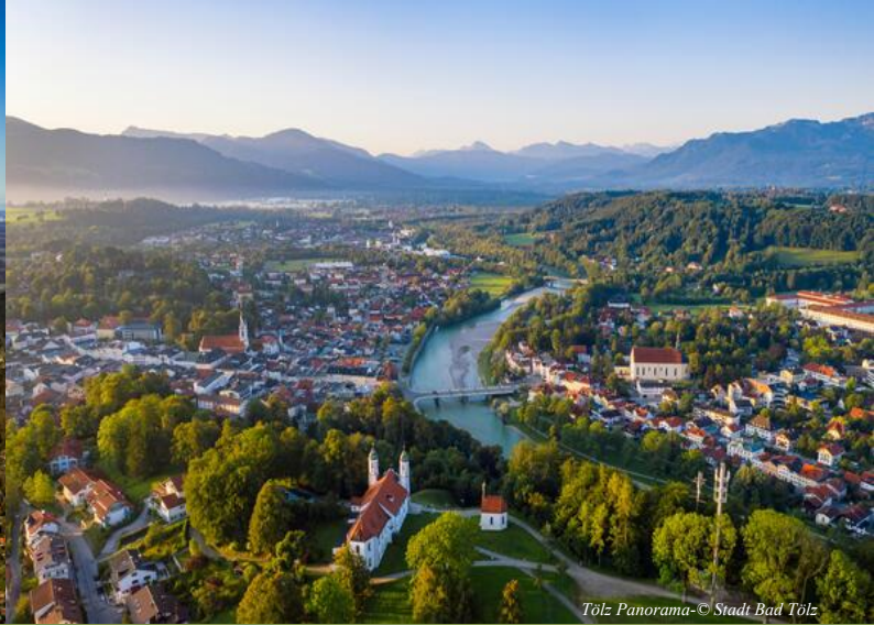
Tölz Panorama-© Stadt Bad Tölz