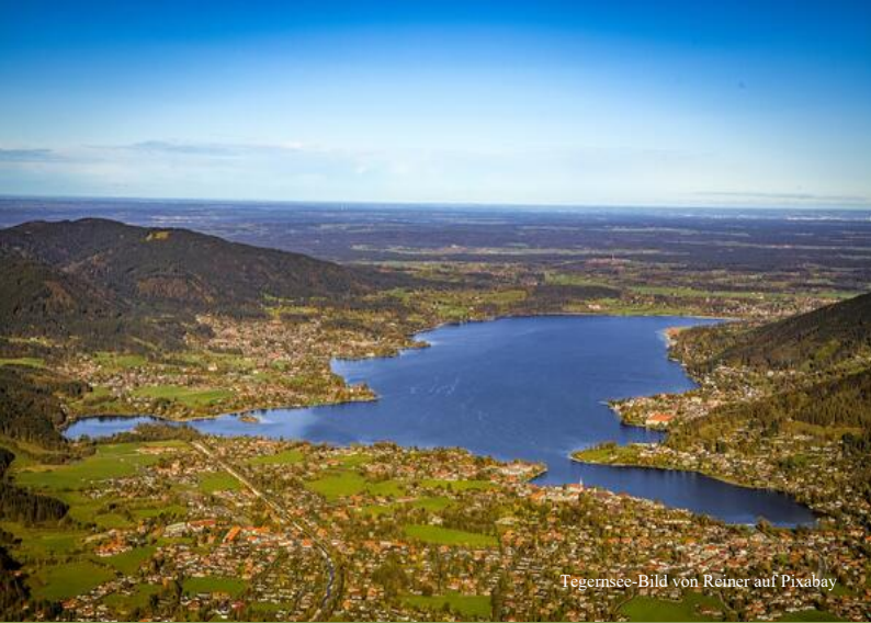
Tegernsee-Bild von Reiner auf Pixabay