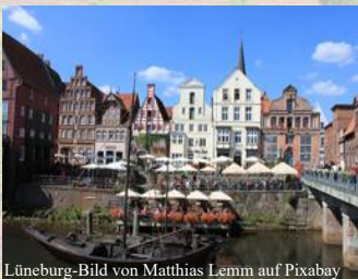
Lüneburg-Bild von Matthias Lemm auf Pixabay

Nach dem Frühstück vom Buffet verabschieden wir uns von der Lüneburger Heide und treten die Heimreise an.