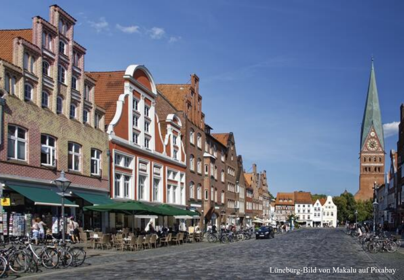
Lüneburg-Bild von Makalu auf Pixabay