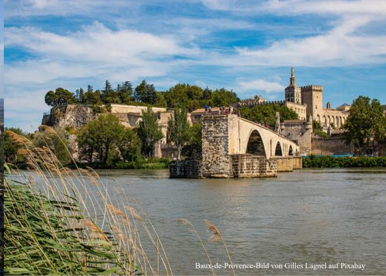
Baux-de-Provence-Bild von Gilles Lagnel auf Pixabay