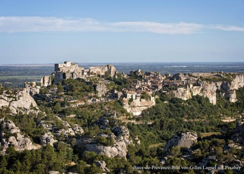
Baux-de-Provence-Bild von Gilles Lagnel auf Pixabay